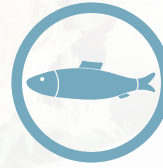
الأسماك ومنتجاتها Fish