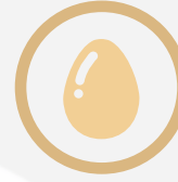
البيض ومنتجاته Eggs