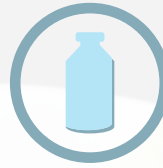
الحليب ومنتجاته Milk