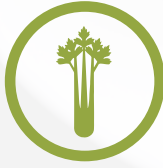
الكرفس ومنتجاته Celery