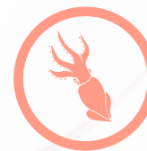
الرخويات ومنتجاتها Mollusks