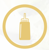
الذردل ومنتجاته Mustard