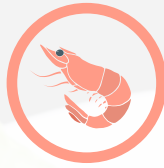
القشريات ومنتجاتها Crustaceans