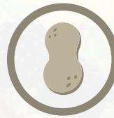
المكسرات ومنتجاتها Tree Nuts