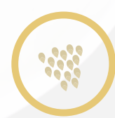
ذول السمسم Sesame

البيانات التغذوية الإضافية متاحة عند الطلب *Additional nutrition facts available upon request