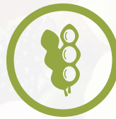
ذول الصويا ومنتجاته Soybean